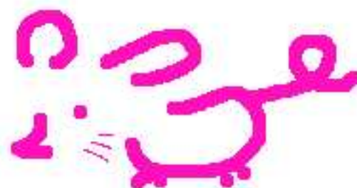
こずみっくちゅー