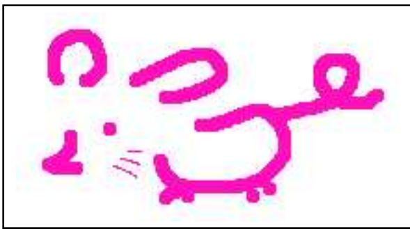
こずみっくちゅー